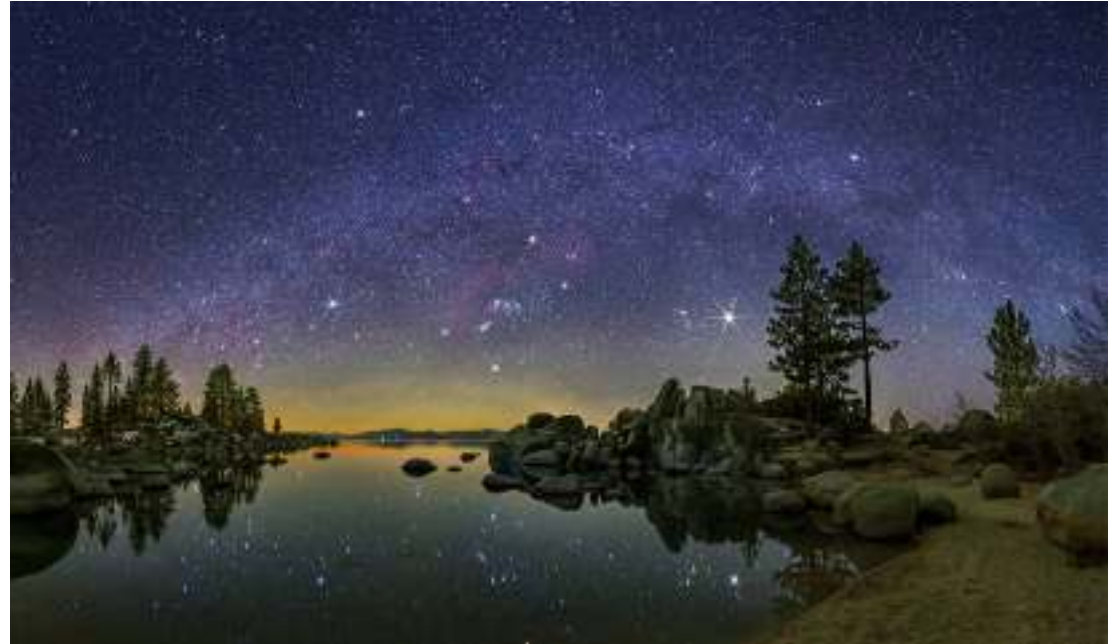
La Voie lactée avec Orion vue depuis le Lac Tahoe dans le Nevada (Etats Unis).