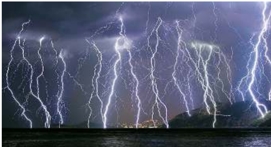
Un ciel d'orage.

Lorsque l'air est sec et que tu te brosses les cheveux ou que tu les frottes avec un ballon, ils se chargent d'électricité et se soulèvent de façon rigolote.