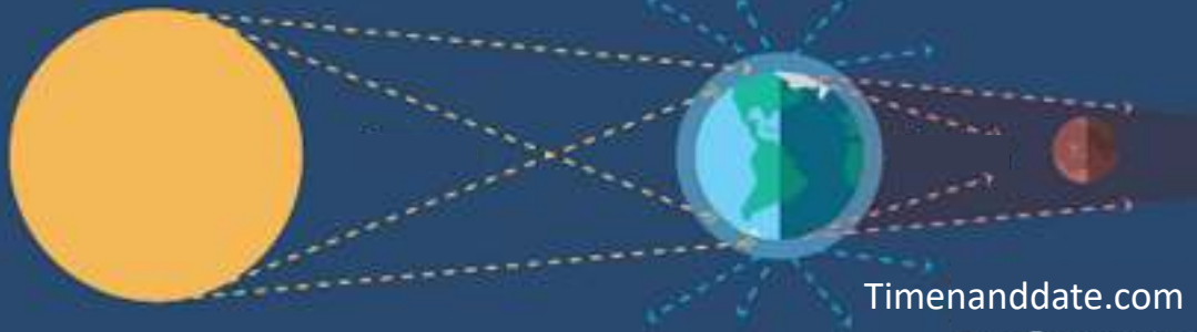
Schéma d'une éclipse de lune (le schéma n'est pas à l'échelle). Les rayons du Soleil sont bloqués par la Terre. Seuls ceux qui ont traversé l'atmosphère terrestre au coucher ou au lever du Soleil atteignent la Lune. Ces rayons lumineux sont rouges ; la lumière bleue a été dispersée.

C'est pourquoi la Lune est rouge lors d'une éclipse totale, comme le montre la photo de droite.