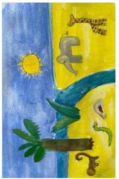
Teessuma Lafaa Lafarraa

Geengawaa, bishaaniin, gaarreniin, bosonaan kan marfarne, fi akkasumas gammoojjiiwwan, fi bakka uumamni lubbu-qabeeyyiin garagaraa miliyoonotaan keessa jiraatan?