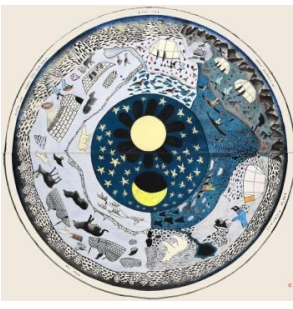
"Samii fi waktillee" hojii hoggessa aartii Innuuyit Keenjuuwaak Asevaakiin.

Ujji furgugifamtuu Chilee keessaati. Xiyoo'ni ifaa waan bakka tokkoo dhufan fakkaatu