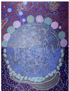
"Samii Waloo", hojii waloo hoggessota aartii Awustiraaliyaa fi Afrikaa kibbaa irraan.

Muraasni isaanii akka calaqqee ifaa xiqqootti jiaan samii keessatti argamuu danda'u. Teleskooppiidhaan, bocasaanii naannawaa fi halluu ykn bifasani arguun hi dandeessa.