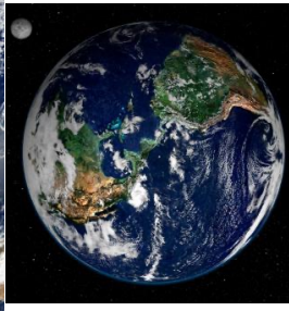
Fakkii Lafaa Saatalaayitii NASA'n fudhatame. Kaabaa fi Kibba Arneenkaa agarsiisa.