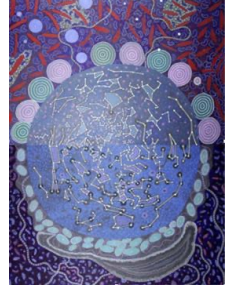
"O céu compartilhado", uma obra coletiva de artistas da Austrália e da África do Sul.

Essas não são estrelas, mas pequenos detritos do espaço. Estas partículas queimam quando entram na atmosfera e deixam um rastro de luz. Quando a Terra cruza o caminho de um cometa que espalhou uma nuvem de poeira atrás dele, vemos uma "chuva de estrelas cadentes". As "chuvas" mais fortes ocorrem nos meses de agosto e outubro.