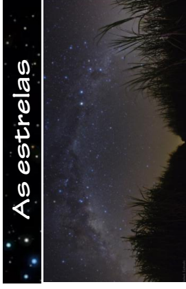
Uma foto do centro da Via Láctea tirada no Brasil. À direita, pode ser vista a constelação do Cruzeiro do Sul.

Elas podem ser vistas como pontos brilhantes no céu assim que escurece.