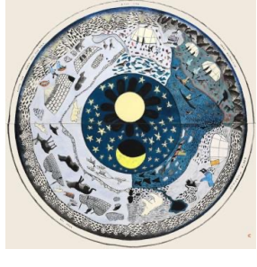
"O céu e as estações", uma obra da artista inuíte Kenjuak Ashevak.