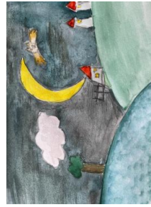
Uma paisagem com a Lua

Quem é redondo e amarelo, quem se levanta e se deita?