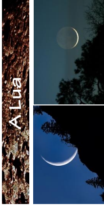
Lua crescente "de pé"