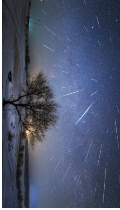
Uma chuva de estrelas cadentes no Chile. Os raios de luz parecem vir do mesmo ponto.