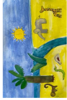
Uma paisagem na Terra

Alguns podem ser vistos a olho nu e parecem pequenos pontos de luz no céu. Através de um telescópio, podemos enxergar sua forma redonda e suas cores.