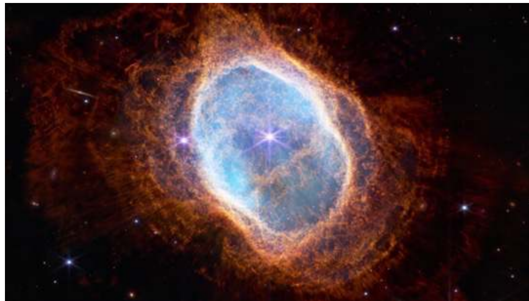
La nebulosa planetaria NGC 3132, llamada nebulosa del anillo del Sur.

Las estrellas como el Sol terminan inflándose a tal grado que expulsan su atmósfera mientras que el núcleo se contrae y convierte en una estrella muy caliente que ilumina la esfera de gas en expansión. Aparece una nebulosa planetaria, como la que se muestra en la ilustración. (ver TUIMP 36).