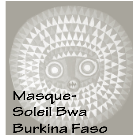
Masque-Soleil Bwa Burkina Faso