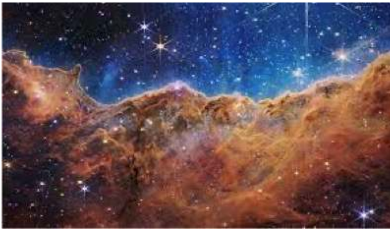
Les étoiles et leurs planètes se forment au sein de nuages de gaz et de poussières dans le milieu interstellaire.

Les atmosphères des étoiles comme le Soleil finissent par se dilater et sont éjectées tandis que le noyau se contracte en une étoile très chaude qui illumine la sphère de gaz en expansion. Une nébuleuse planétaire apparaît, comme celle de la photo ci-contre. (voir TUIMP 36).