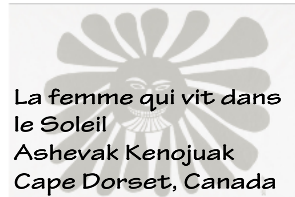
La femme qui vit dans le Soleil Ashevak Kenojuak Cape Dorset, Canada