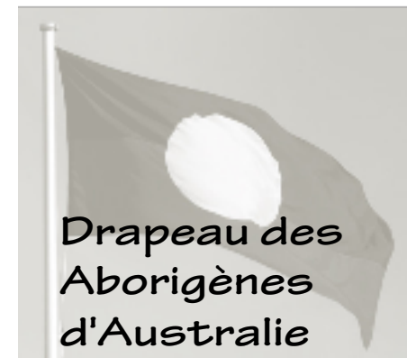
Drapeau des Aborigènes d'Australie