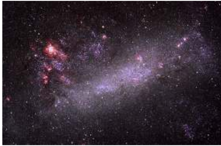
Duumessa Maajelaanikii guddicha, gaalaksii isa Milki-weyiitti baay'ee dhihoo ta'e.