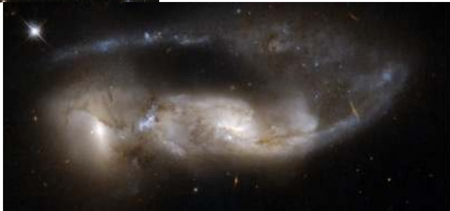
NGC 6621 fi NGC 6622, wal'irba gaalaksota cimdii. Faccisni isaa eegee dheeraa NGC 6621 keessaa harkiseera.