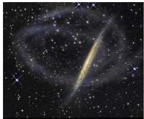
Yaa'ota horbiiftuu culculee naannoo roggee gaalaksii margundoo NGC 5907 irratti.