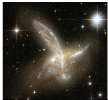
ESO 593-8: wal'irba gaalaksota cimdii. Cimdiin kun tarii fuulduraatti gaalaksii biroo tokko uumuu mala.