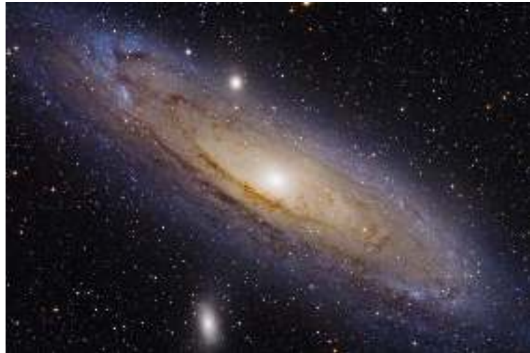
M31, Gaalaksii Andiroomeedaa, gaalaksii mar-gundoo isa baay'ee dhihoo. Fakkichi Loorenzoo Kaamoliin, teeleskoppii xiqqaa ta'e fayyadamuun kan fudhatamee dha.