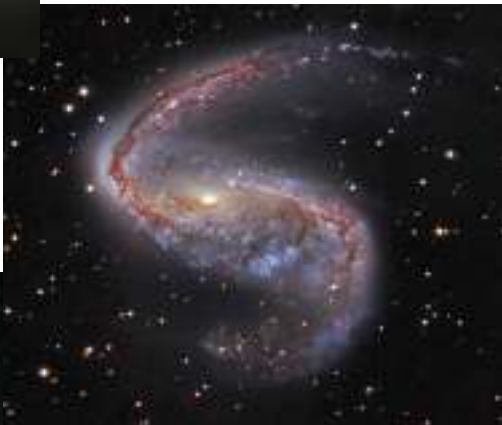
Deebiin fuula- qopheerra