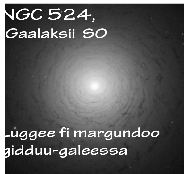
NGC 524, Gaalaksii SO