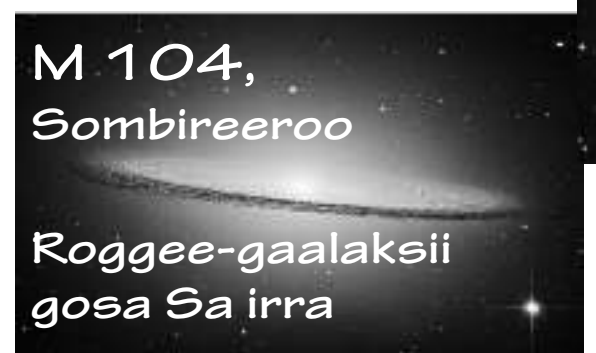
M 104, Sombireeroo