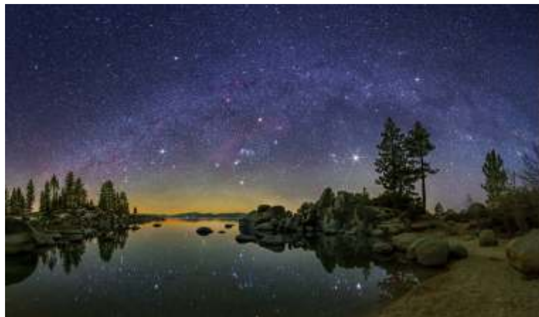
Rruga e Qumështit dhe Orioni, parë nga Liqeni Tahoe në Nevada (USA).