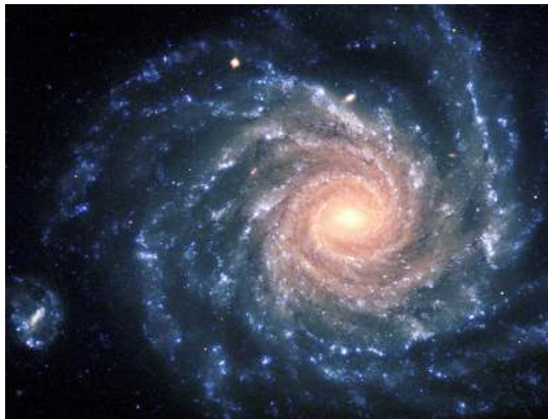
Galaksia spirale NGC 1232 dhe shoqëruesja e saj më e vogël NGC 1232A. Kjo foto është marrë me VLT (Very Large Telescope) nga ESO në Kili.