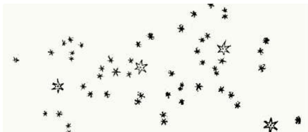
Vizatimi i Rrugës së Qumështit pranë Orionit nga Galileo: yjëzat e vogla tregojnë yjet më të zbehta.

Kushdo prej nesh e ka parë një brez të gjerë drite të bardhë që përshkon qiellin e netëve të errëta. Grekët e lashtë e quanin Rruga e Qumështit. Për egjiptianët dhe kinezët e vjetër ai ishte një lumë qiellor, ndërsa popujve të Siberisë u dukej si tegeli ku qepej çadra e qiellit.