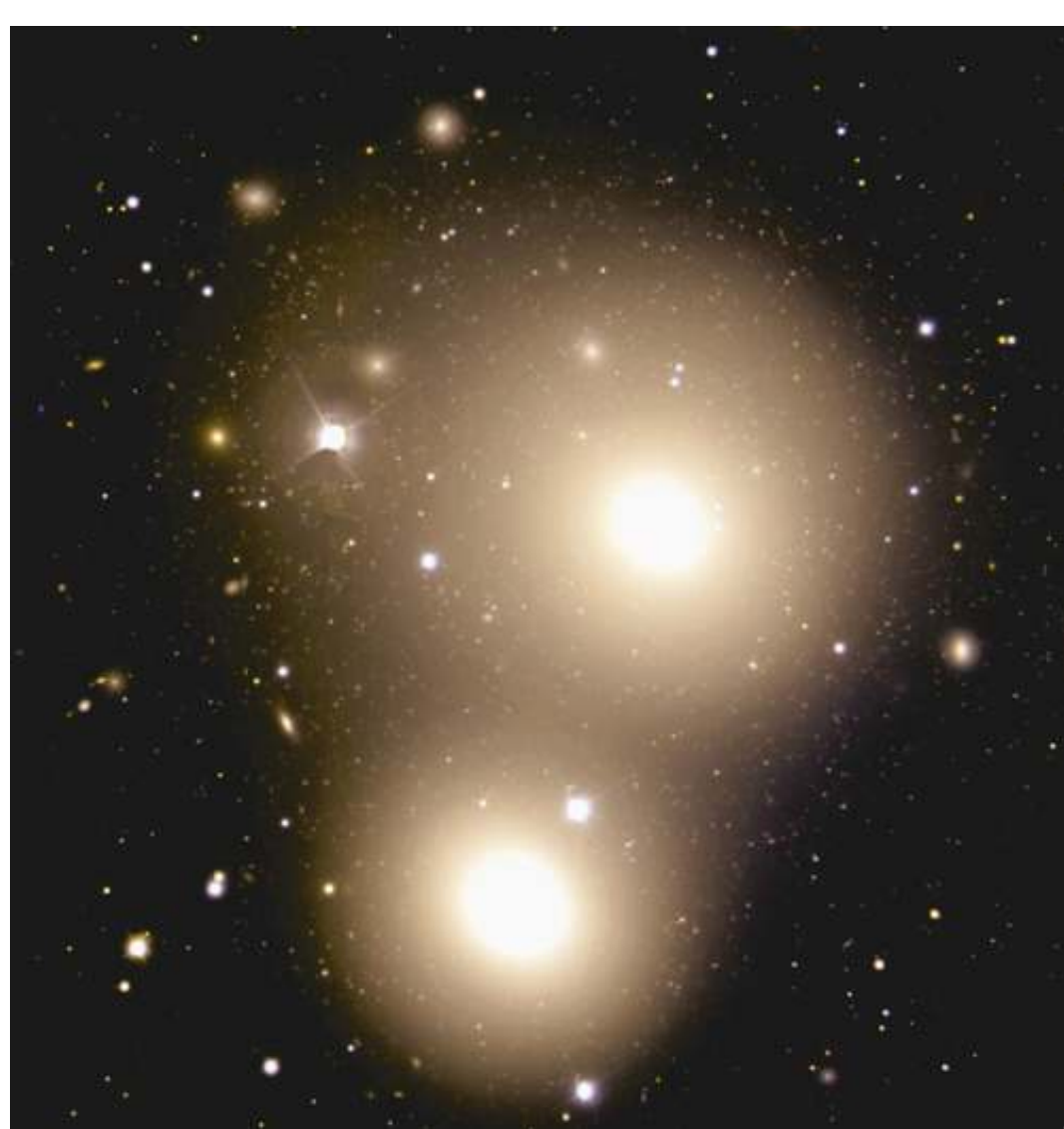
Dy galaksi eliptike: NGC 3311 dhe NGC 3309.