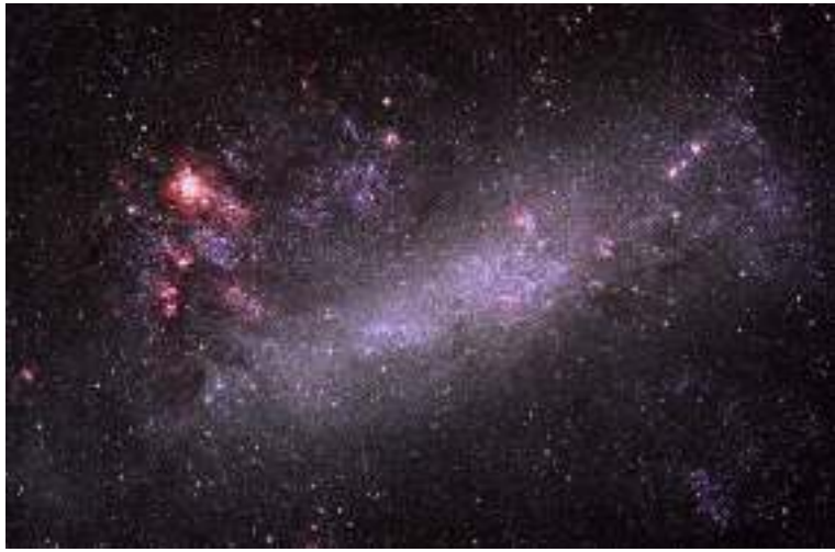
Reja e Madhe e Magelanit, galaksia më e afërt me Krugën e Qumështit.