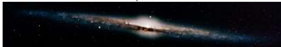
NGC 4565: një galaksi spirale e parë anash.